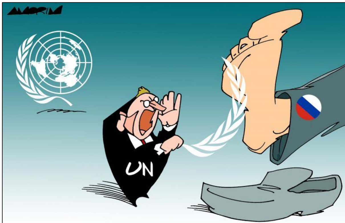
Caricature parue en mars 2022, réalisée par le caricaturiste brésilien Amorim.