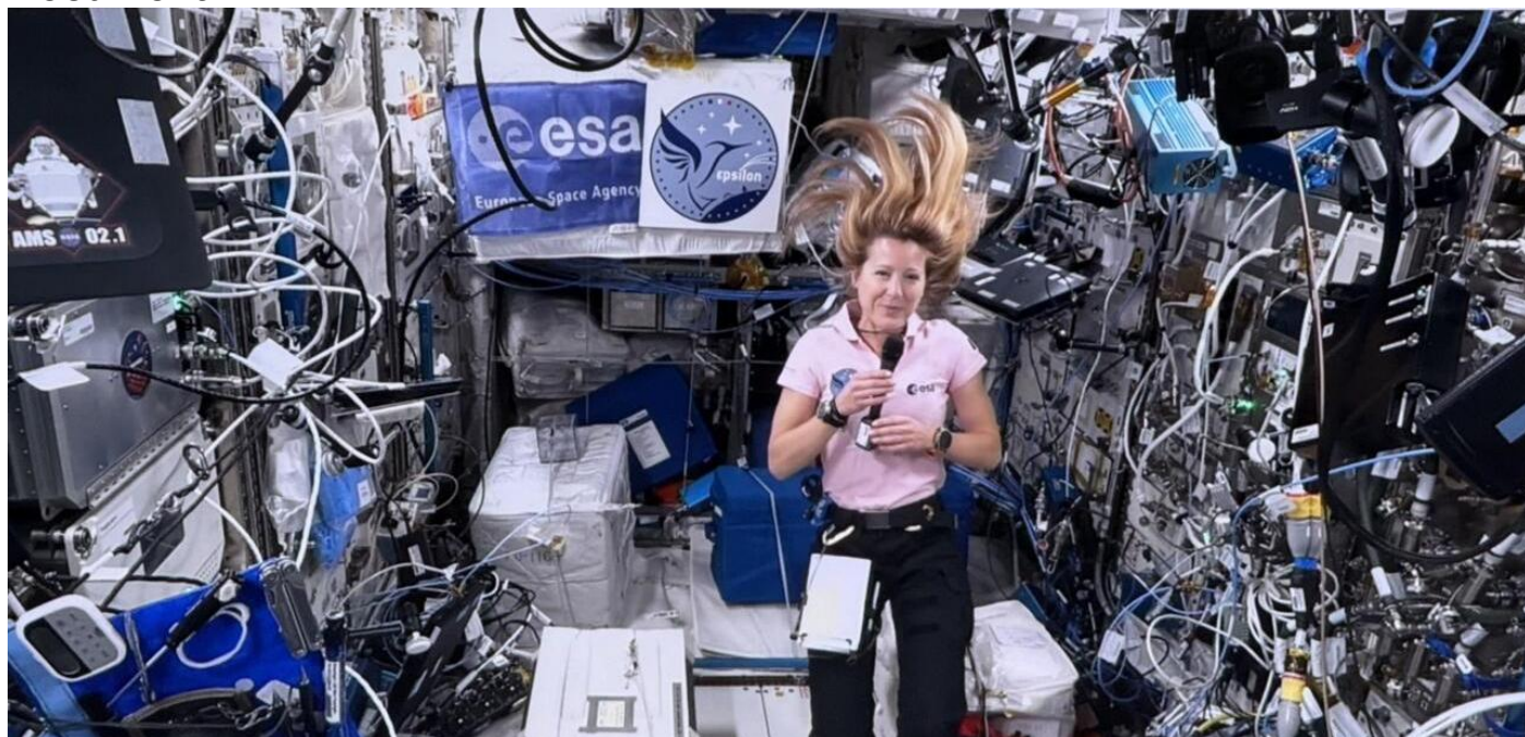
Sophie Adenot en contact avec l'ESA depuis l'ISS, le 27 février 2026.