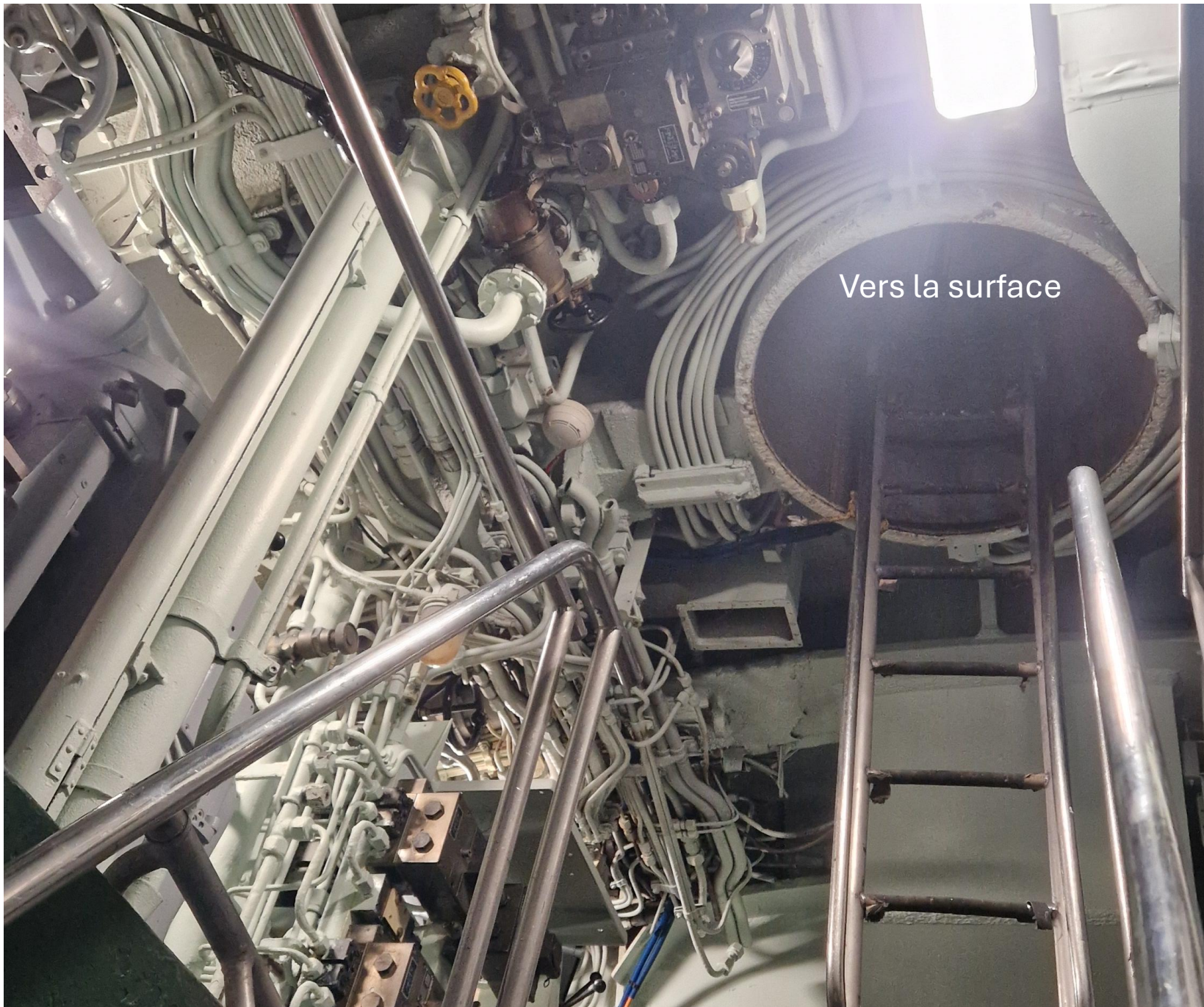
Vers la surface