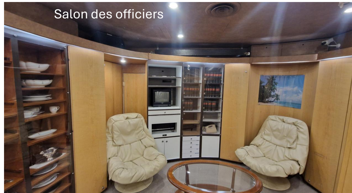
Salon des officiers