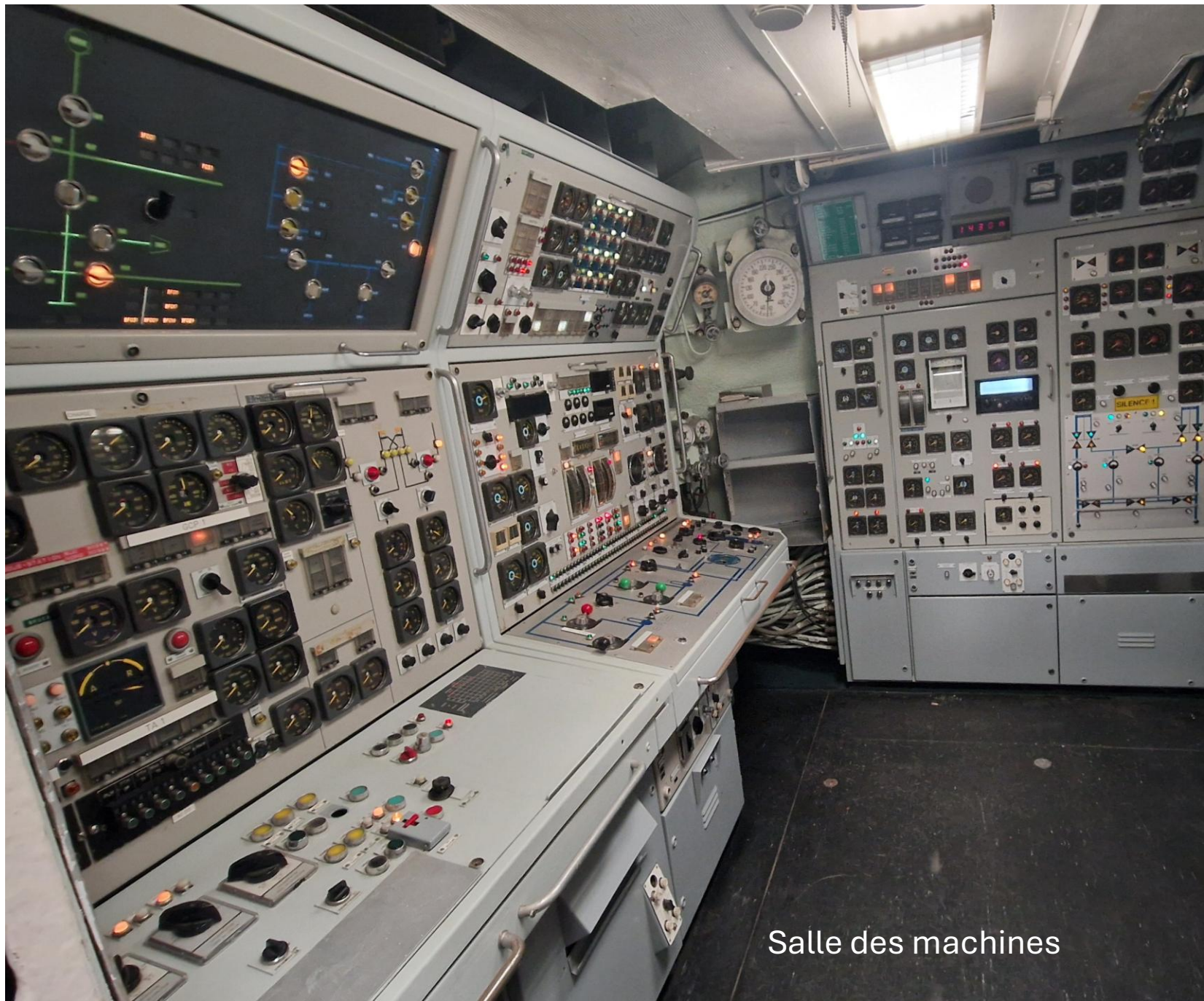
Salle des machines