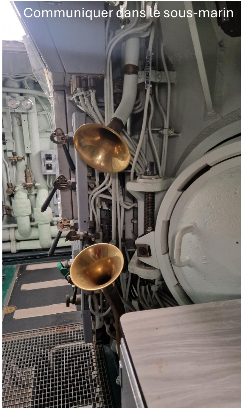
Communiquer dans le sous-marin